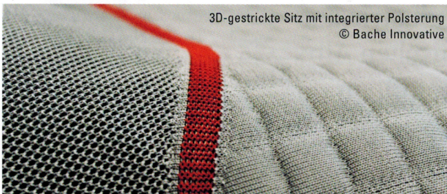
3D-gestrickte Sitz mit integrierter Polsterung © Bache Innovative

Das Besondere an dem Sitz ist die Kombination verschiedener Strukturen und Techniken, so kommen sowohl Mesh-Strukturen, Intarsia- und Spickeltechnik als auch ein Schusseintrag zum Einsatz. Beim Schusseintrag werden Strick- und Webtechnik miteinander kombiniert, zwischen zwei Stricklagen wird ein Füllfaden aus Polyamid eingelegt, wodurch eine gezielte Polsterung einzelner Bereiche umsetzbar ist. Durch exakte Maschenpositionierung wird zudem eine maschengenaue, eingestrickte Steppnahtoptik erzielt. Neben dem Einlegen von