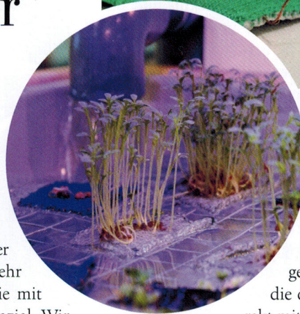
Projekt „Vertical Farming“, aufgenommen während der Hannover Messe am Stand des Projektpartners FH Bielefeld

Füllfäden bietet das Verfahren auch die Möglichkeit zum Eintragen von elektrisch leitfähigen Fäden, die dank der zwei Stricklagen nicht direkt mit der Haut in Kontakt kommen.